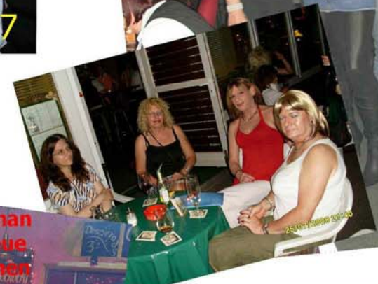
Bei euch lernte man immer wieder neue Schwestern kennen