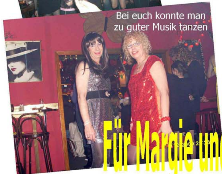
Bei euch konnte man zu guter Musik tanzen