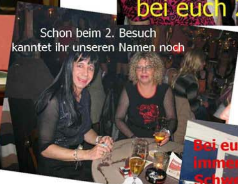
Schon beim 2. Besuch kannet ihr unseren Namen noch