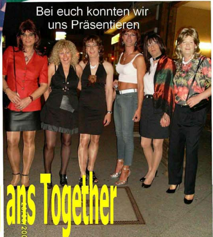
Bei euch konnten wir uns Präsentieren