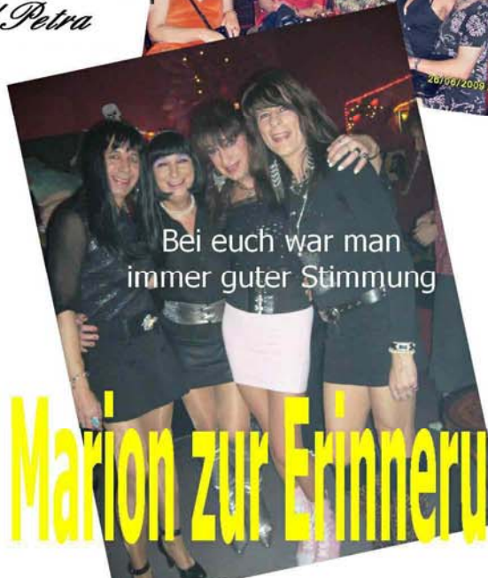
Bei euch war man immer guter Stimmung